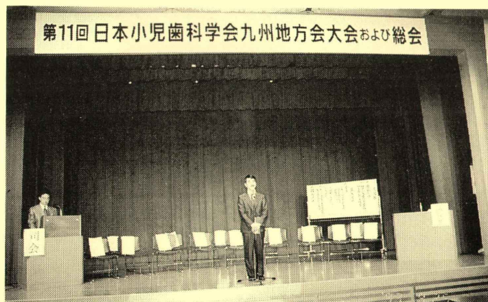
本川渉大会会長挨拶